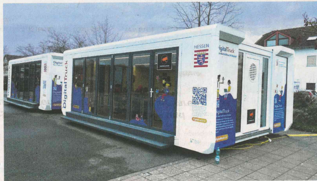
Der Digitaltruck ist noch bis zum morgigen Freitag in Eppertshausen.

Zu Beginn der Pandemie konnte sehr schnell an der Grundschule ein digitaler Unterricht, sowie unterrichtsergänzende Maßnahmen angeboten werden.